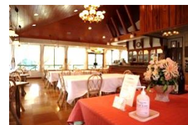
レストラン入口でアルコール消毒を