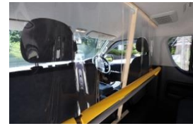
運転席はシールドを設置