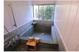
個室温泉で安心(例:大島1号)