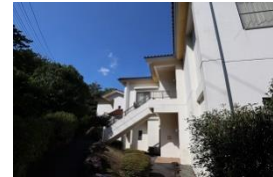
他の利用者との接触が少ないコテージ