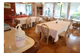
アルコール製剤を複数個所配置