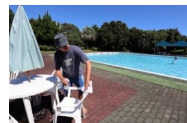
お帰りの際はテーブル席の除菌