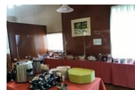
飛沫防止と定期的な清拭消毒