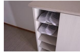
スリッパは使い捨てに変更