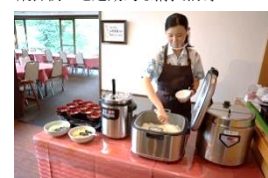
一部料理は取分けを行っております。