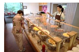
飛沫防止と定期的な清拭消毒