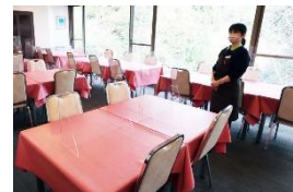
対面用アクリル板を設置しています