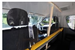
運転席はシールドを設置