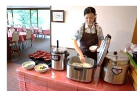
一部料理は取分けを行っております。