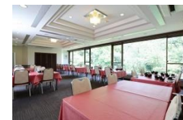
ゆったりとしたテーブルプラン