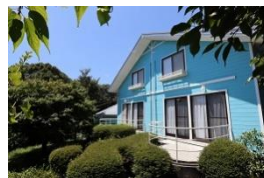
他の利用者との接触が少ないロテージ