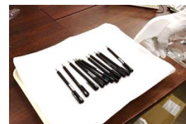
ペンは一回一回消毒しています