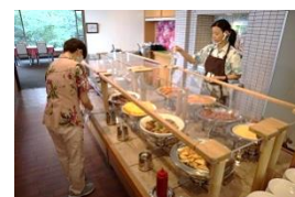
飛沫防止と定期的な清拭消毒