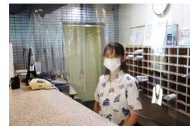
フロントシールド