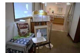
レストラン入口でアルコール消毒を