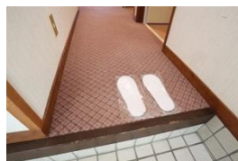
スリッパは使い捨てに変更