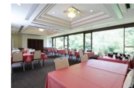
ゆったりとしたテーブルプラン