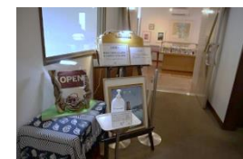
レストラン入口でアルコール消毒を