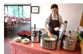
一部料理は取分けを行っております。