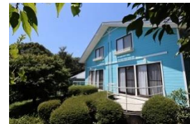
他の利用者との接触が少ないロテージ