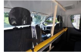
運転席はシールドを設置