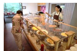
飛沫防止と定期的な清拭消毒