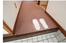
スリッパは使い捨てに変更