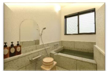
室内の温泉かけ流し風呂